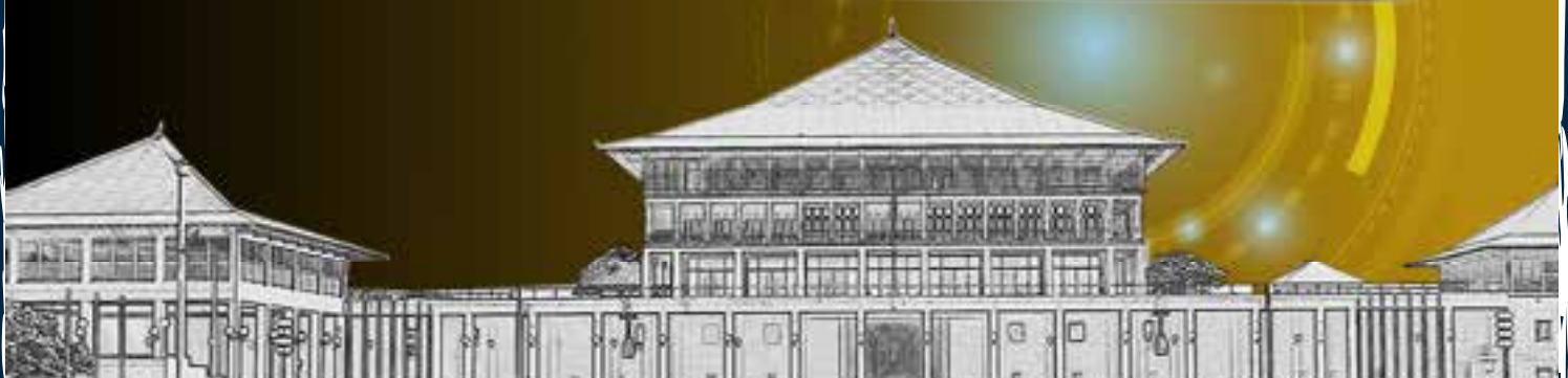
මෙවර සටහන - චී. ඊ. ජනකාන්ත සිල්වා - අධ්‍යක්ෂ (ව්‍යවස්ථාදායක සේවා) / අධ්‍යක්ෂ (සන්නිවේදන) (වැඩබලන)