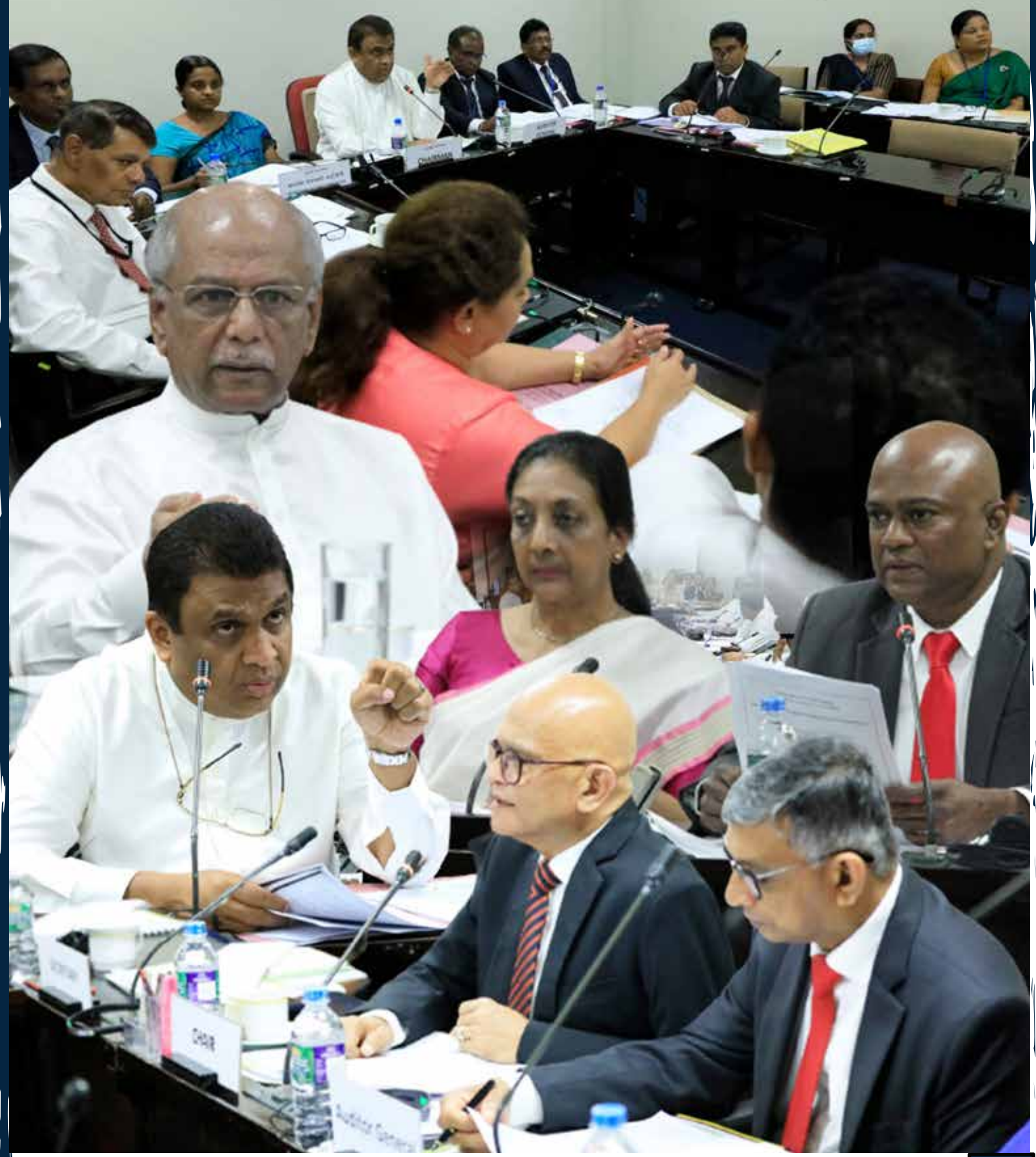
සන්නිවේදන දෙපාර්තමේන්තුව - ශ්‍රී ලංකා පාර්ලිමේන්තුව