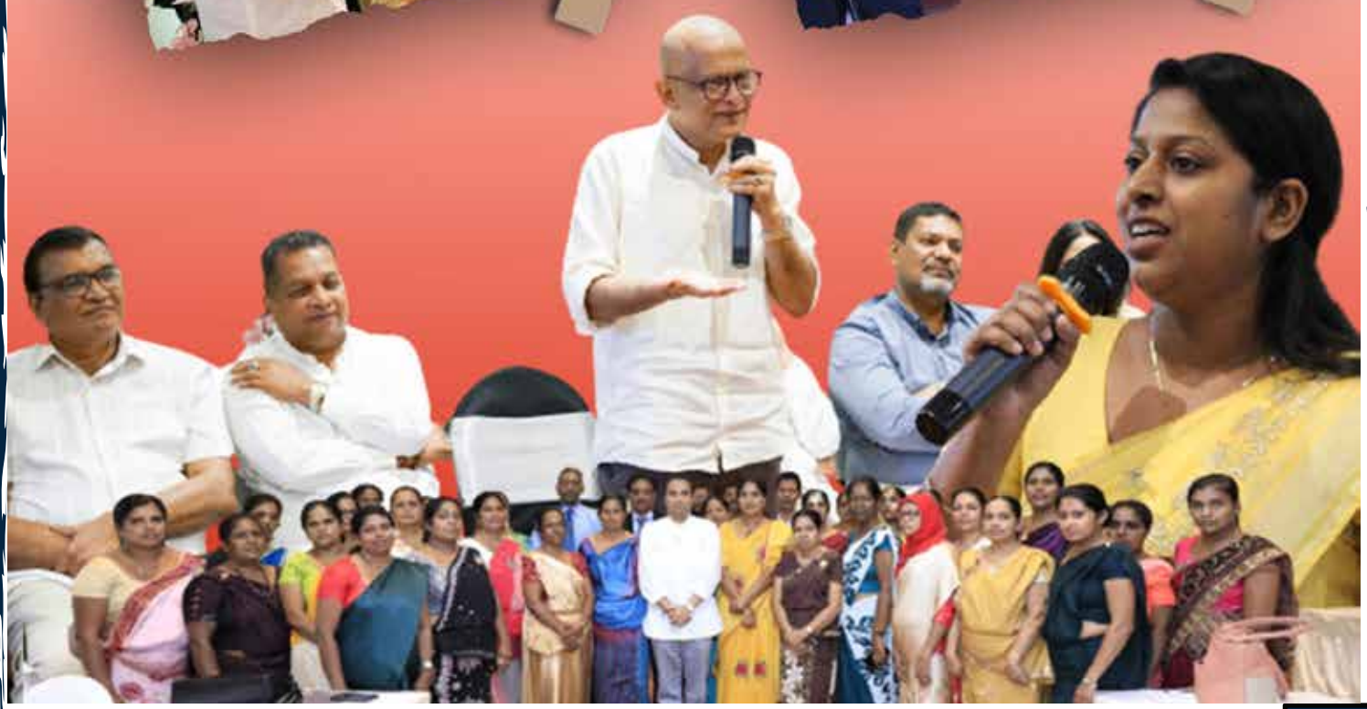
සන්නිවේදන දෙපාර්තමේන්තුව - ශ්‍රී ලංකා පාර්ලිමේන්තුව