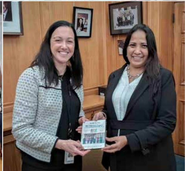
සන්නිවේදන දෙපාර්තමේන්තුව - ශ්‍රී ලංකා පාර්ලිමේන්තුව