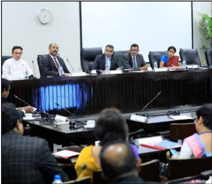
එසේම කැලෑ ගිනිතැබීම් විශාල වශයෙන් පසුගිය කාලසීමාව තුළ වාර්තා වූ බවත් ඒවා නැවැත්වීමට වැඩපිළිවෙළක් ආරම්භ කරන බවත් අමාත්‍ය ගරු ප්‍රමීත බණ්ඩාර තෙන්නකෝන් මහතා සඳහන් කළේය.

මෙහිදී දීර්ඝ වශයෙන් සිවිල් ආරක්ෂක බලකාය සම්බන්ධයෙන් සාකච්ඡා වීම සිදු වූ අතර අලි මිනිස් ගැටුම සමනය කිරීම සඳහා සිවිල් ආරක්ෂක බලකායේ නිලධාරීන්ගෙන් ඉහළ සහයක් ලැබෙන බවද පැමිණ සිටි මන්ත්‍රීවරු සඳහන් කළහ. එසේම මෙම නිලධාරීන්ට අවශ්‍ය ඉන්ධන පහසුකම් සහ අනෙකුත් පහසුකම් ලබාදීම පිළිබඳව ද මෙහිදී සාකච්ඡා විය.